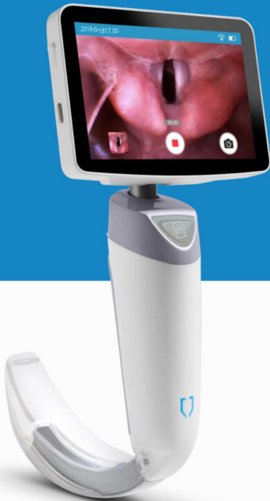
Laryngoskop Wideo VS-10 H